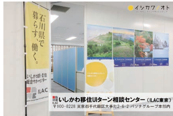
ILAC東京の入り口には石川の四季のポスターが飾られている

まず、石川と東京（ILAC東京）の両方に、「仕事」と「暮らし」のワンストップ相談窓口を設置した点です。移住・転職は人生の大きな転機です。「石川にはどんな仕事があるのか」「経験を活かせる仕事はあるのか」「住まいや暮らしはどうなるのか」など気になることは多いと思います。