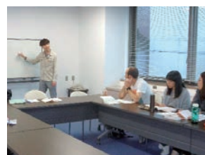
イム先生 (韓国文化)