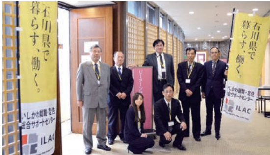
人材コーディネーターの皆さん

企業の方からは「ILACは当社の特徴をよく理解してくれていて、当社が求める人材、逆に求めていなくても当社にとって必要な人材を『当意即妙』で紹介してくれ感謝している」といった感想や、相談者からも「初めての転職で不安だったが、ILACに相談することで、転職活動が『個人戦』から『チーム戦』になった感じがして心強く、無事Uターンすることができた」と感謝の言葉を頂いており、また、そのことが私どもにとって大いに励みとなっております。