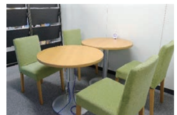
ILAC東京の相談スペース

ILACの窓口には専任の相談員がおり、相談者一人一人に寄り添い親身になってサポートしています。特に、ILAC東京はJR東京駅から徒歩1分というアクセスのよい場所にあります。また、本県専用の相談スペースになっており、プライバシーも守られ、ゆっくりと、落ち着いて相談することができます。