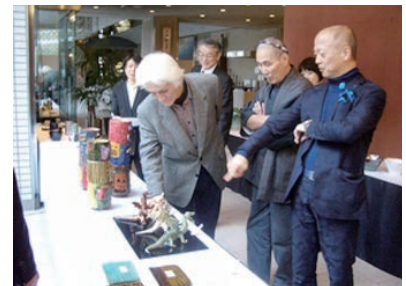
第29回 審査会の様子