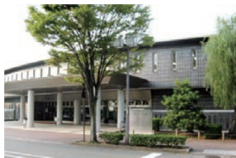
いしかわ就職・定住総合サポートセンター外観

その基本目標の1つである「学生のUターン・県内就職と移住定住の促進」を達成するための実行部隊が「いしかわ就職・定住総合サポートセンター」であり、