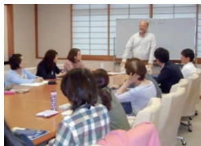
タスケン先生 (英米文化)