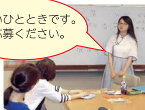
リョウ先生 (中国文化)